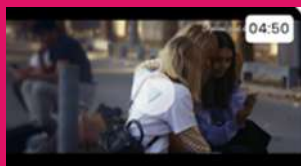
"Le porno, c'est du cinéma"