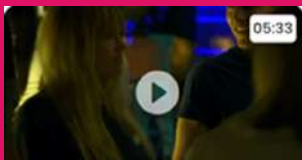
"Non c'est non !"