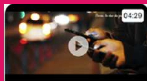
"Porno, le choc du premier clic"